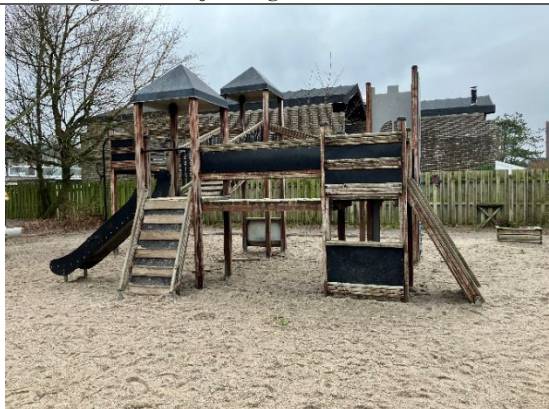
Redskab: Legetårn med rutsjebane Årgang: Producent: Er redskabet mærket: Nej Er der registreret fejl/mangler: Ja