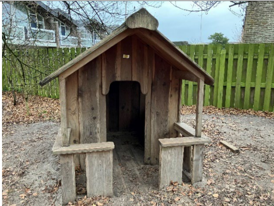
Redskab: Legehus Årgang: 2010 Producent: Egen produktion Er redskabet mærket: Ja Er der registreret fejl/mangler: Ja