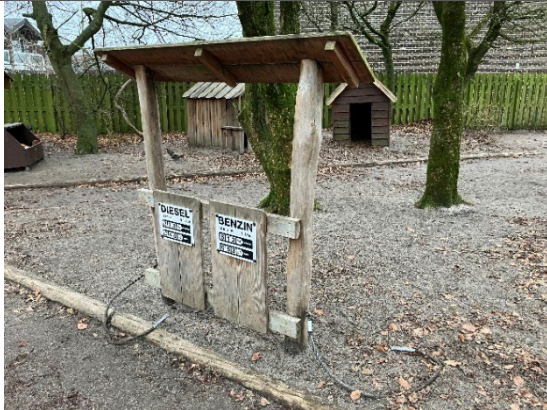
Redskab: Tankstander Årgang: 2017 Producent: Nikostine Er redskabet mærket: Ja Er der registreret fejl/mangler: Nej