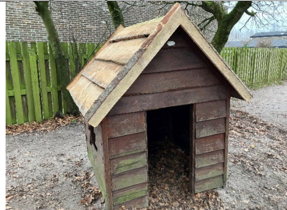
Redskab: Legehus Årgang: 2010 Producent: Dica Er redskabet mærket: Ja Er der registreret fejl/mangler: Nej