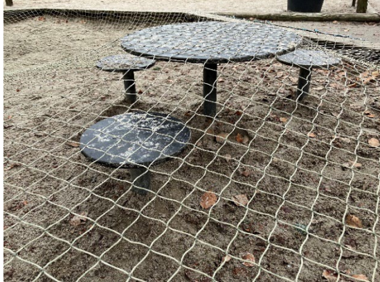
Redskab: Sandbord sæt Årgang: Producent: Er redskabet mærket: Nej Er der registreret fejl/mangler: Nej