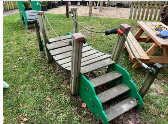
Redskab: Lege bro Årgang: 2010 Producent: Egen produktion Er redskabet mærket: Ja Er der registreret fejl/mangler: Nej