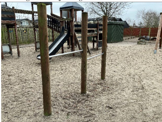
Redskab: Svingbom Årgang: 2015 Producent: Egen produktion Er redskabet mærket: Ja Er der registreret fejl/mangler: Nej