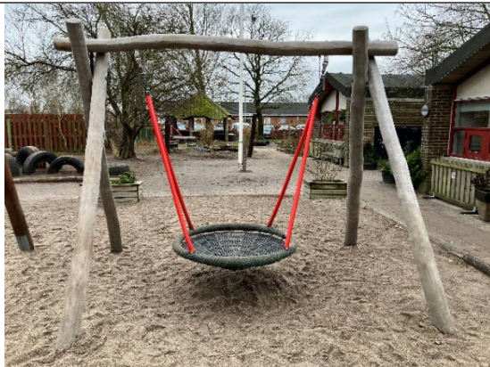
Redskab: Redegyng Årgang: 2024 Producent: Rudeco Er redskabet mærket: Ja Er der registreret fejl/mangler: Ja