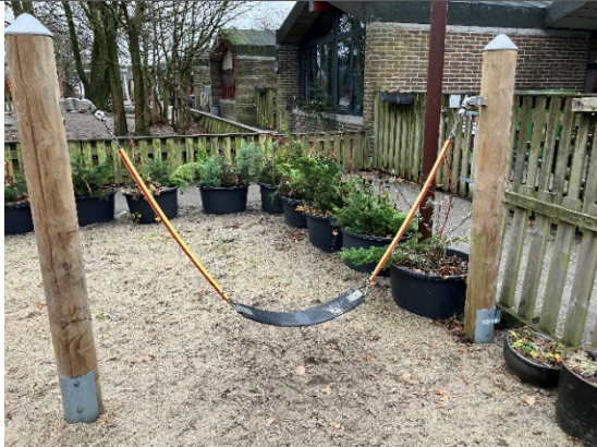
Redskab: Mavegynge Årgang: 2015 Producent: Rejstrup Savværk Er redskabet mærket: Ja Er der registreret fejl/mangler: Nej