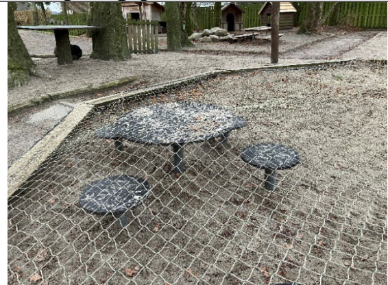
Redskab: Sandbord sæt Årgang: Producent: Er redskabet mærket: Nej Er der registreret fejl/mangler: Nej