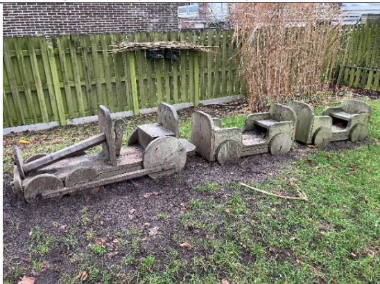
Redskab: Lege tog Årgang: 2017 Producent: Nikostine Er redskabet mærket: Ja Er der registreret fejl/mangler: Nej