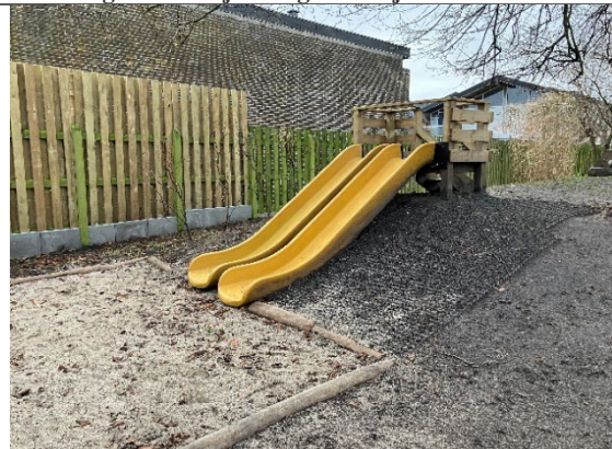
Redskab: Rutsjebaner Årgang: 2023 Producent: Kompan/ H.E Industries Er redskabet mærket: Ja Er der registreret fejl/mangler: Ja