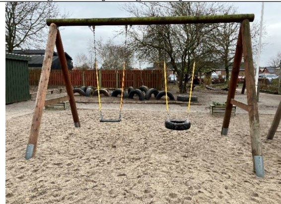
Redskab: Gyngestativ Årgang: 2014 Producent: Rejstrup Savværk Er redskabet mærket: Ja Er der registreret fejl/mangler: Ja