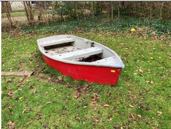
Redskab: Båd Årgang: 2019 Producent: Egen produktion Er redskabet mærket: Ja Er der registreret fejl/mangler: Nej