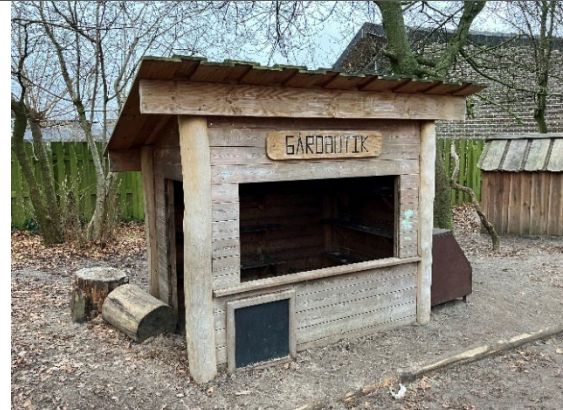
Redskab: Gårdbutik Årgang: 2017 Producent: Nikostine Er redskabet mærket: Ja Er der registreret fejl/mangler: Ja