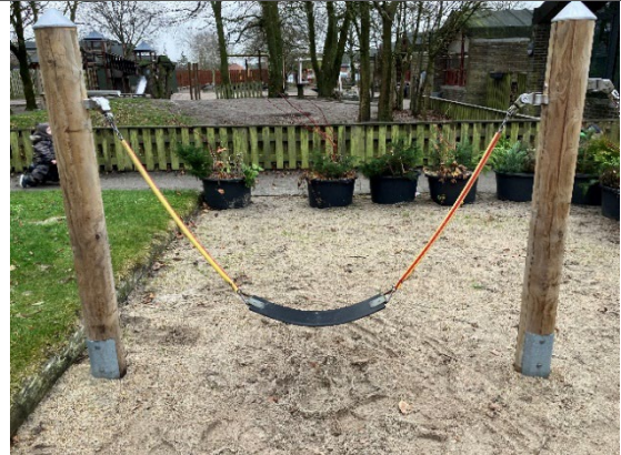
Redskab: Mavegynge Årgang: 2015 Producent: Rejstrup Savværk Er redskabet mærket: Ja Er der registreret fejl/mangler: Nej