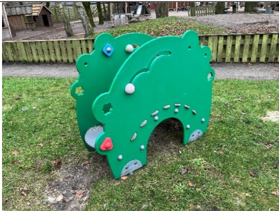
Redskab: Legeredskab Årgang: Producent: Kompan Er redskabet mærket: Ja Er der registreret fejl/mangler: Nej