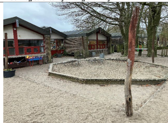
Redskab: Sandkasse med solsejlsstolper Årgang: Producent: Er redskabet mærket: Ja men ikke læselig Er der registreret fejl/mangler: Ja