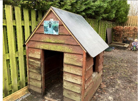
Redskab: Legehus Årgang: 2010 Producent: Dica Er redskabet mærket: Ja Er der registreret fejl/mangler: Nej