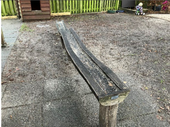
Redskab: Vandleg Årgang: 2017 Producent: Norleg Er redskabet mærket: Ja Er der registreret fejl/mangler: Nej