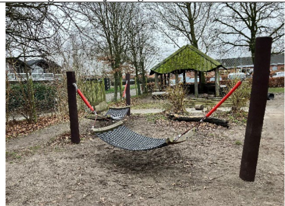
Redskab: Hængekøjer Årgang: 2010 Producent: Nikostine Er redskabet mærket: Ja Er der registreret fejl/mangler: